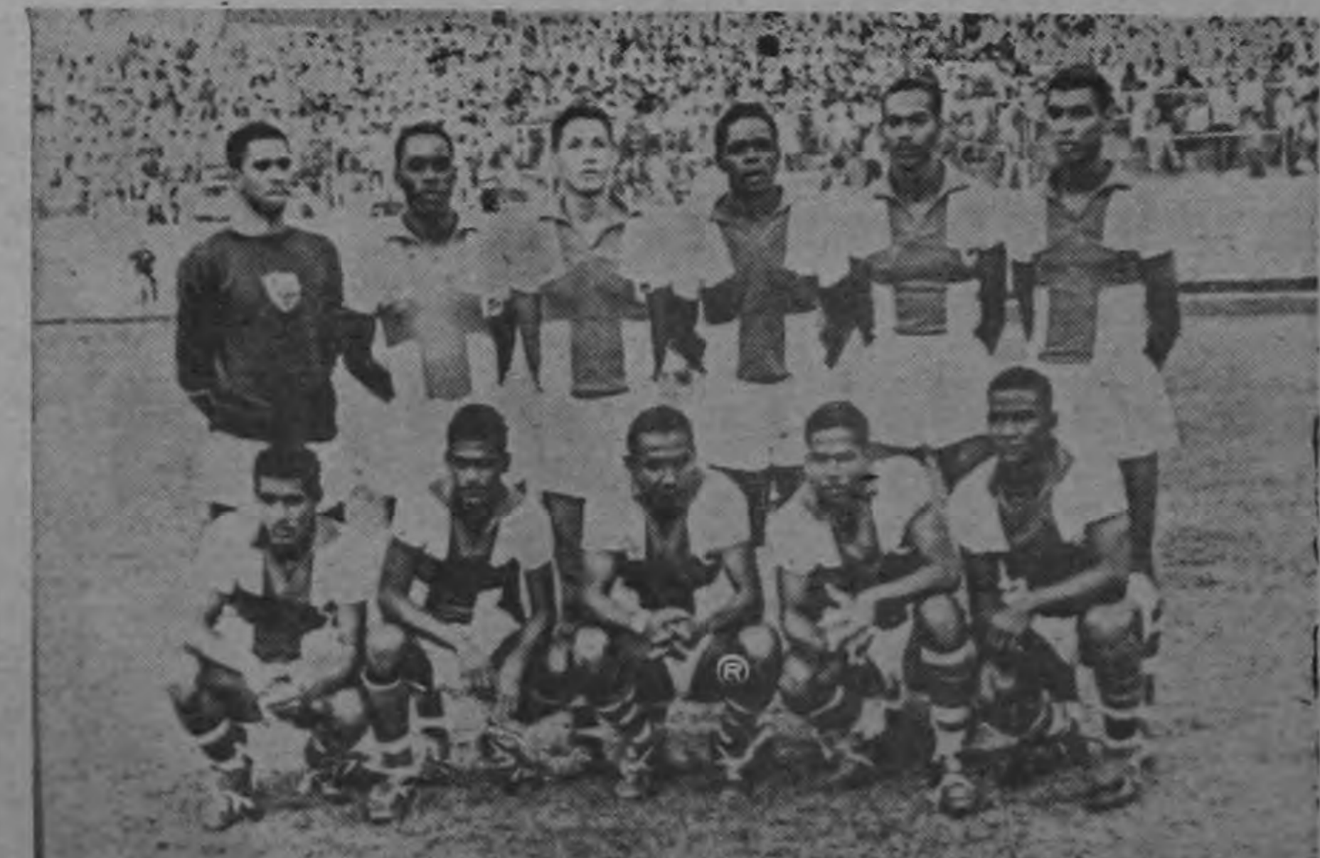
Esta es la selección de Antillas Neerlandesas que está participando en el Campeonato de El Salvador. Anoche perdieron ante Costa Rica por un gol a cero, pero a pesar de la derrota son los as-

El Secretario del Milán dijo que ese Club pagó unos 150 millones de liras (240.000 dólares) además de ceder a Del Vecchio al Boca Juniors.