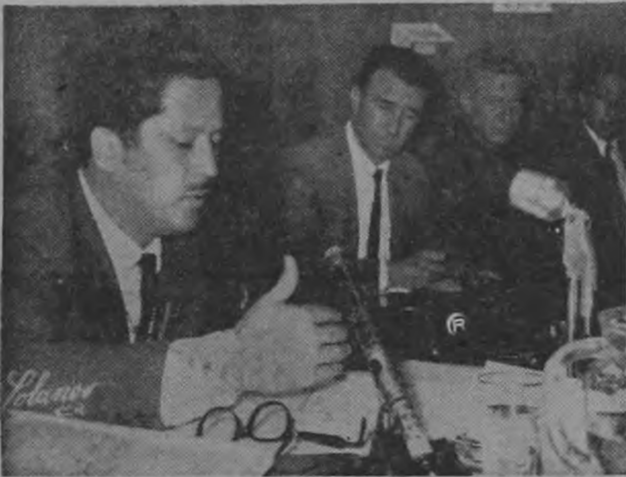
ORTUÑO. ...análisis, de forma...