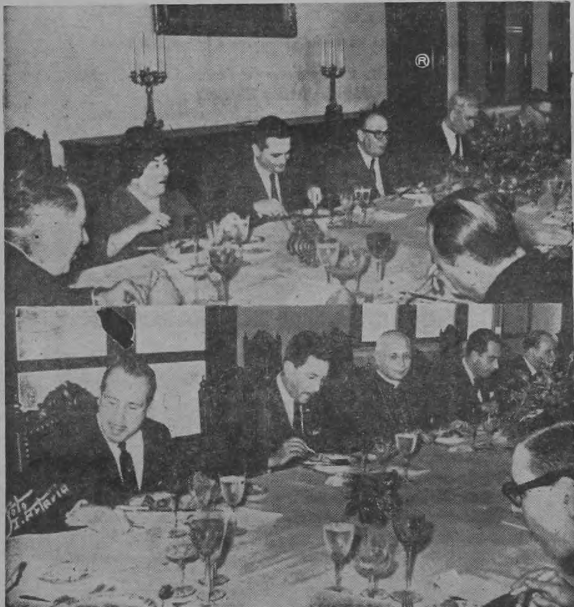
En la Nunciatura Apostólica le fue ofrecido un almuerzo al señor Presidente de la República don Francisco Orlich y altos funcionarios del Go-