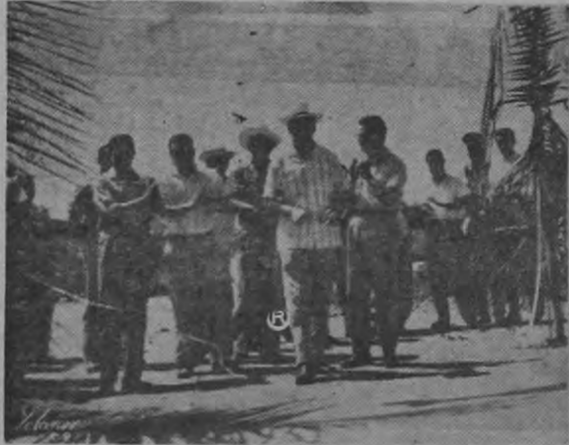
El señor Presidente, Ministros de Obras Públicas y Educación y el Diputado Solano Orfila en el momento que el señor Orlich cortaba la cinta que daba por inaugurado el puente sobre el Río Cañas. Numerosos vecinos concurrieron al acto. (Foto SOLANOV).

El valor de adjudicación de dichas viviendas resultó ser de la suma de seis mil cien colones y se informó que los adjudicatarios habían obtenido plazos entre los 15 y 30 años para pagar pero que la mayoría de ellos había obtenido plazo de veinte años. Las cuotas a pagar oscilan entre los ¢33.70 y ¢41.75 mensuales que incluyen el servicio de agua potable, tasas municipales etc. La inauguración oficial de dicha urbanización, como lo adelantamos en ediciones anteriores, se llevará a cabo el próximo domingo a las diez de la mañana.