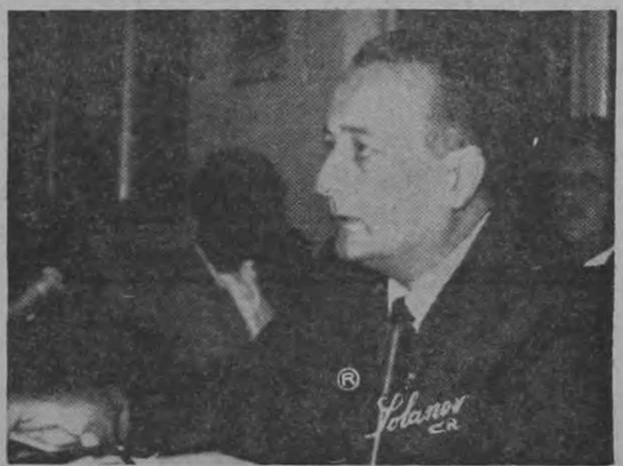
GARRÓN ...brecha en monopolios...