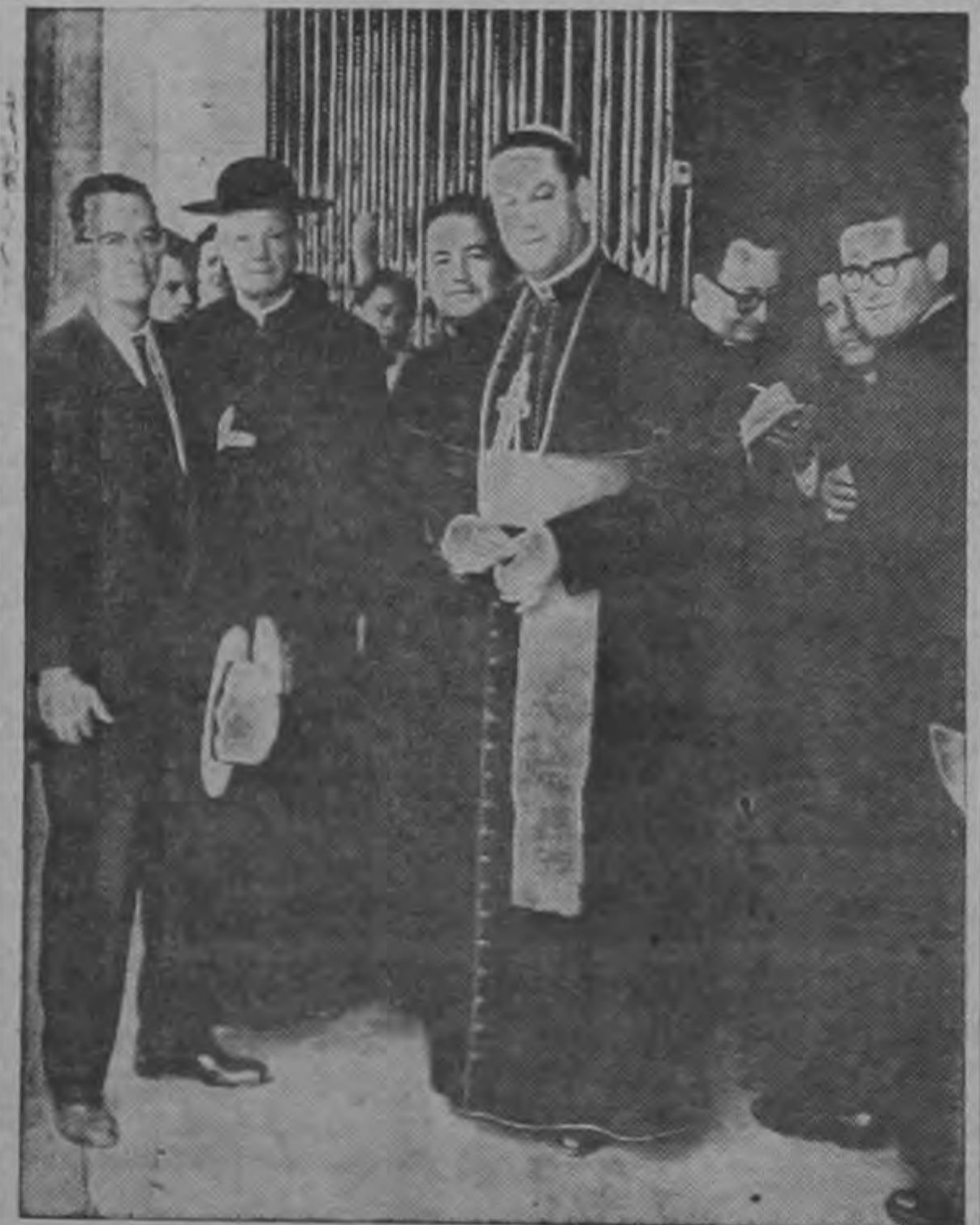
"La película religiosa que supera en mucho a todas las que he visto sobre el mismo Tema Sagrado".—MONS. RODRIGUEZ.

Costa Rica necesita un sanatorio donde atender debidamente a las personas que padecen de alcoholismo.