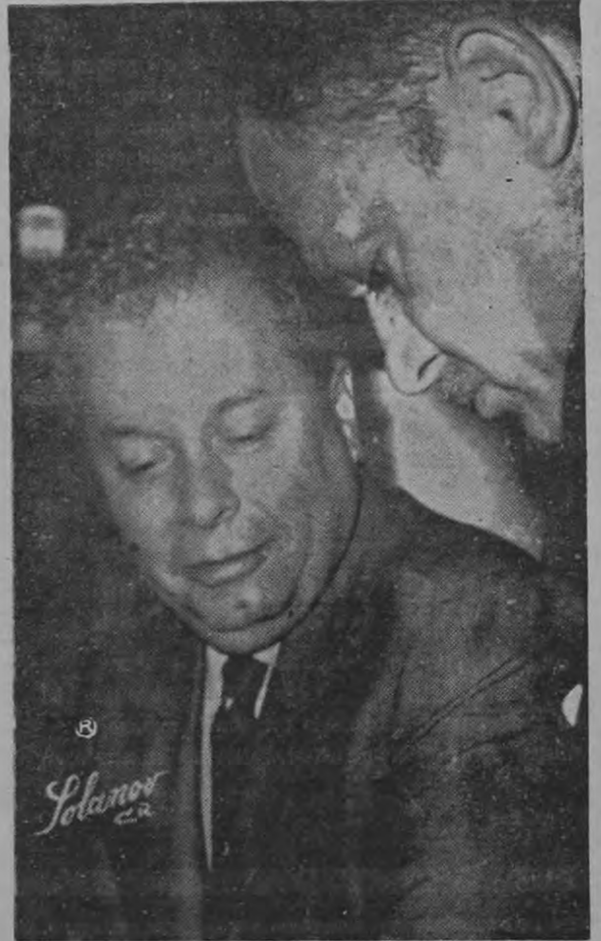
DISTINGUIDO INVITADO — El Licenciado Benito Coquet Director del Instituto Mexicano del Seguro Social, suministrando declaraciones a nuestro reportero Zúñiga Quesada en el Hotel Europa. El Lic. Coquet es un destacado mexicano a quien se cita como un posible Presidente de la República de México.

El amarillismo de algunos diarios y emisoras nacionales, como se ve, aparte de injustificado está perjudicando el aporte de divisas extranjeras a la economía nacional por concepto de turismo.